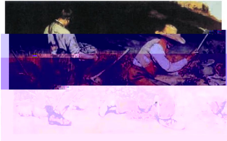
石工 (油画, 1849年) 库尔贝 (法国)