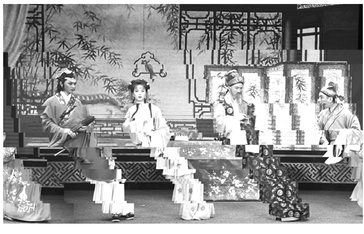
黄梅戏曲千秋唱, 徽风皖韵万古传。3月18日晚, 由H共

X. 详细CD$ : , OnUV X, E, oC, E, I J 2 = _前; n`a